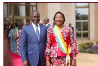
Monsieur Adama BICTOGO, Président de l'Assemblée nationale aux côtés de la Présidente du Sénat