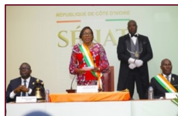
La Présidente du Sénat pendant son discours d'orientation