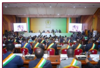
Une vue de l'hémicycle