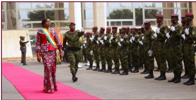
Les honneurs militaires rendus à Madame la Présidente du Sénat

La Présidente du Sénat, Madame Kandia CAMARA, a procédé à l'ouverture de la première session ordinaire du Sénat au titre de l'année 2024, le mercredi 31 janvier 2024, à la Fondation Félix Houphouët-Boigny pour la Recherche de la Paix de Yamoussoukro.