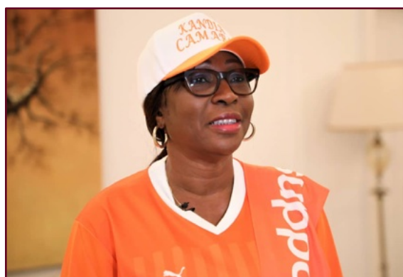
Madame Kandia CAMARA, Présidente du Sénat, Présidente d'honneur du Comité National de Soutien aux Éléphants (CNSE)

La 34 ème édition de la Coupe d'Afrique des nations de football (CAN 2023), se tient en Côte d'Ivoire du 13 janvier au 11 février 2024.