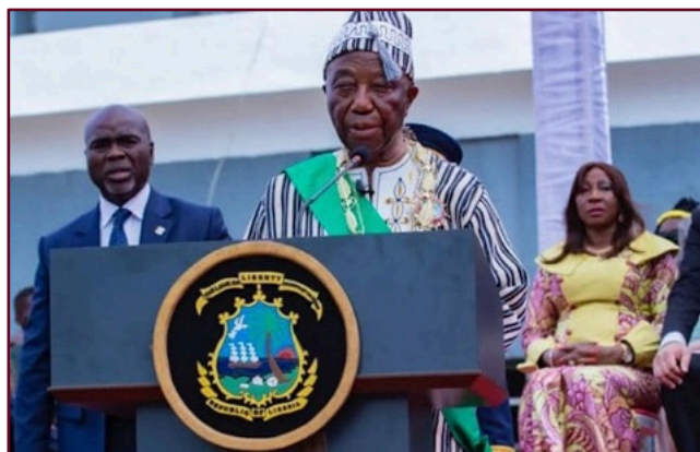
Au pupitre : Son Excellence Monsieur Joseph BOAKAI, nouveau Président du Libéria

La Présidente du Sénat de Côte d'Ivoire, Madame Kandia CAMARA, a représenté le Chef de l'Etat, Son Excellence Monsieur Alassane OUATTARA, à l'investiture du nouveau Président du Libéria, le lundi 22 janvier 2024 à Monrovia.