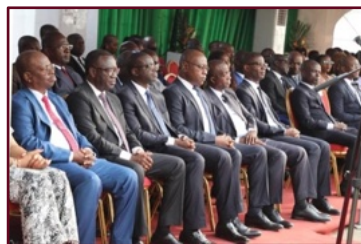
Les membres de l'administration du Sénat