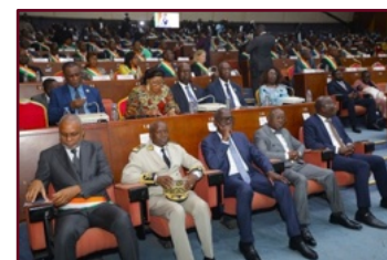
Quelques autorités administratives et politiques locales