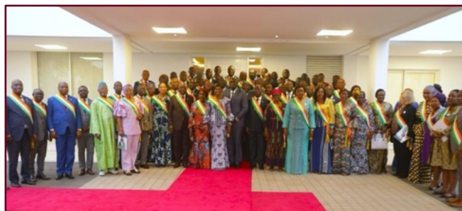
Photo de famille à l'issue de la cérémonie

En marge de l'ouverture de la première session ordinaire 2024 du Sénat, il s'est tenu, le mercredi 31 janvier 2024 au siège de l'Institution, la traditionnelle cérémonie de présentation de vœux des Sénateurs à Son Excellence Madame Kandia CAMARA, Présidente du Sénat.