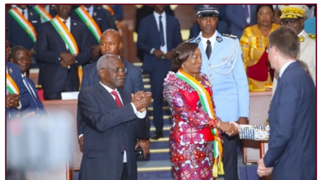
La Présidente du Sénat et le Haut Représentant du Président de la République font leur entrée dans l'hémicycle

Étaient également présents des Présidents d'Institutions, des membres du Gouvernement, des membres du corps diplomatique ainsi que de nombreuses autres personnalités politiques administratives et coutumières.