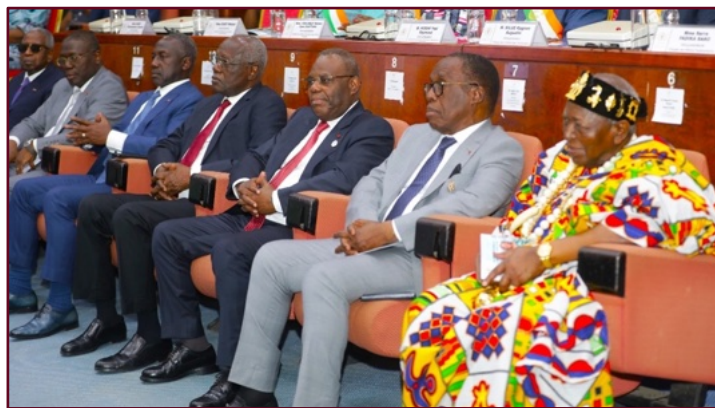
Les Présidents d'Institutions présents à la cérémonie