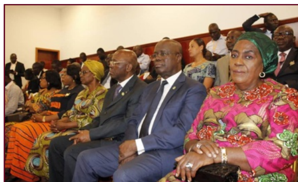
Des membres de la délégation du Sénat présents à la cérémonie

Conformément aux dispositions de l'article 94 de la Constitution, l'Assemblée nationale a procédé, le lundi 22 janvier 2024, à l'ouverture de sa première session ordinaire au titre de l'année 2024.