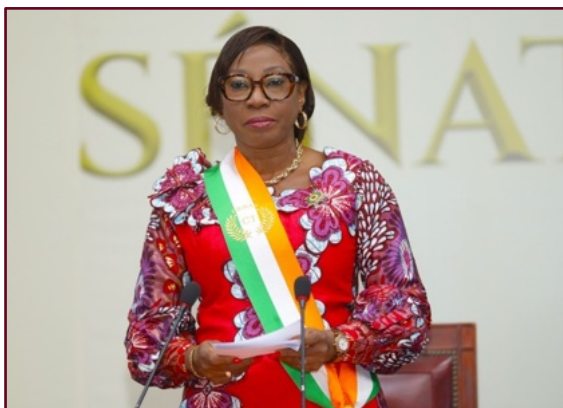
Allocution de Madame Kandia CAMARA, Présidente du Sénat

Dans son discours d'ouverture, la Présidente du Sénat, Madame Kandia CAMARA, a donné les grandes orientations pour cette nouvelle année parlementaire.