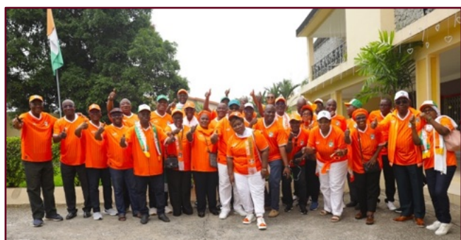
Les Sénateurs et le personnel du Sénat mobilisés pour la victoire des Eléphants de Côte d'Ivoire

Notons que la Présidente du Sénat, Madame Kandia CAMARA, est Présidente d'honneur du Comité National de Soutien aux Eléphants (CNSE).