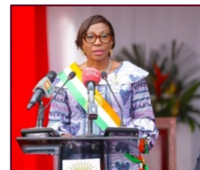
Madame Kandia CAMARA, Présidente du Sénat

Le personnel administratif et technique du Sénat a présenté ses vœux de nouvel an à Son Excellence Madame Kandia CAMARA, Présidente du Sénat, au cours d'une cérémonie solennelle qui s'est déroulée le mercredi 31 janvier 2024 au siège de l'Institution à Yamoussoukro.