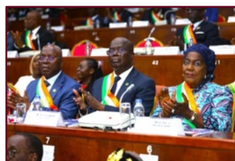
Des vice-Présidents du Sénat